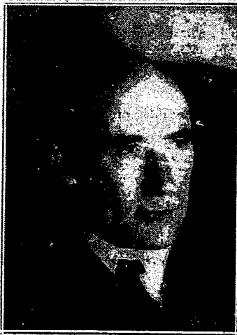
M. ANDRÉ GIDE

« ... Comme il sentait sa fin approcher, il pria par un petit bulletin sa femme de semondre quelques gentilshommes, siens voisins, afin de prendre congé d'eux. Arri-